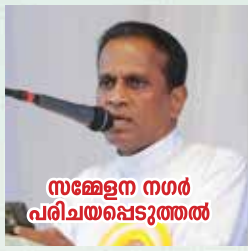
സഭയ്ക്കു നഗര പരിചയപ്പെടുത്തൽ