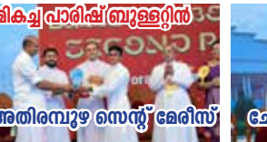
ലിക്വ് പാരിഷ് ബ്രൂള്ളിൻ