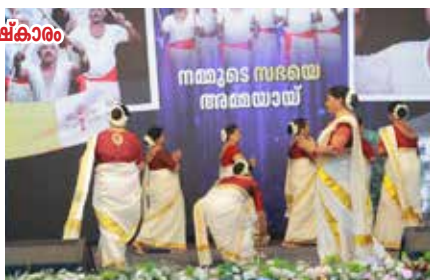
നമ്മുടെ സഭയെ അമ്മയാൽ