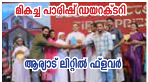
ലിക്വ് പാരിഷ് ഡയറക്ടറി