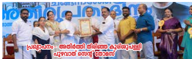
പ്രഖ്യാപനം - അതിർത്തി തിരിഞ്ഞ കുരിശുപള്ളി പുഴവാത് സെന്റ് തോമസ്