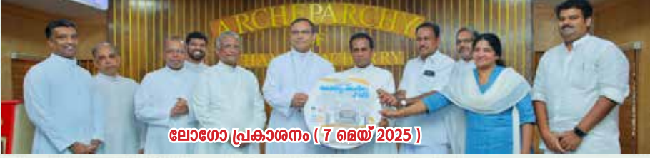
ലോഗോ പ്രകാശനം ( 7 മെയ് 2025 )