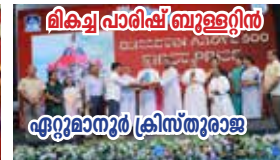
ലിക്വ് പാരിഷ് ബ്രൂള്ളിൻ