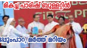
ലിക്വ് പാരിഷ് ബ്രൂള്ളിൻ