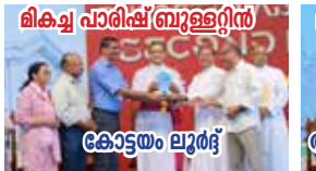
ലിക്വ് പാരിഷ് ബ്രൂള്ളിൻ