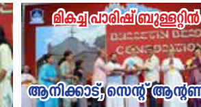
ലിക്വ് പാരിഷ് ബ്രൂള്ളിൻ