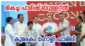
ലിക്വ് പാരിഷ് ബ്രൂള്ളിൻ