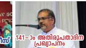
141-ാം അതിരൂപതാദിന പ്രഖ്യാപനം