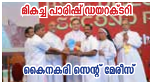
ലിക്വ് പാരിഷ് ഡയറക്ടറി